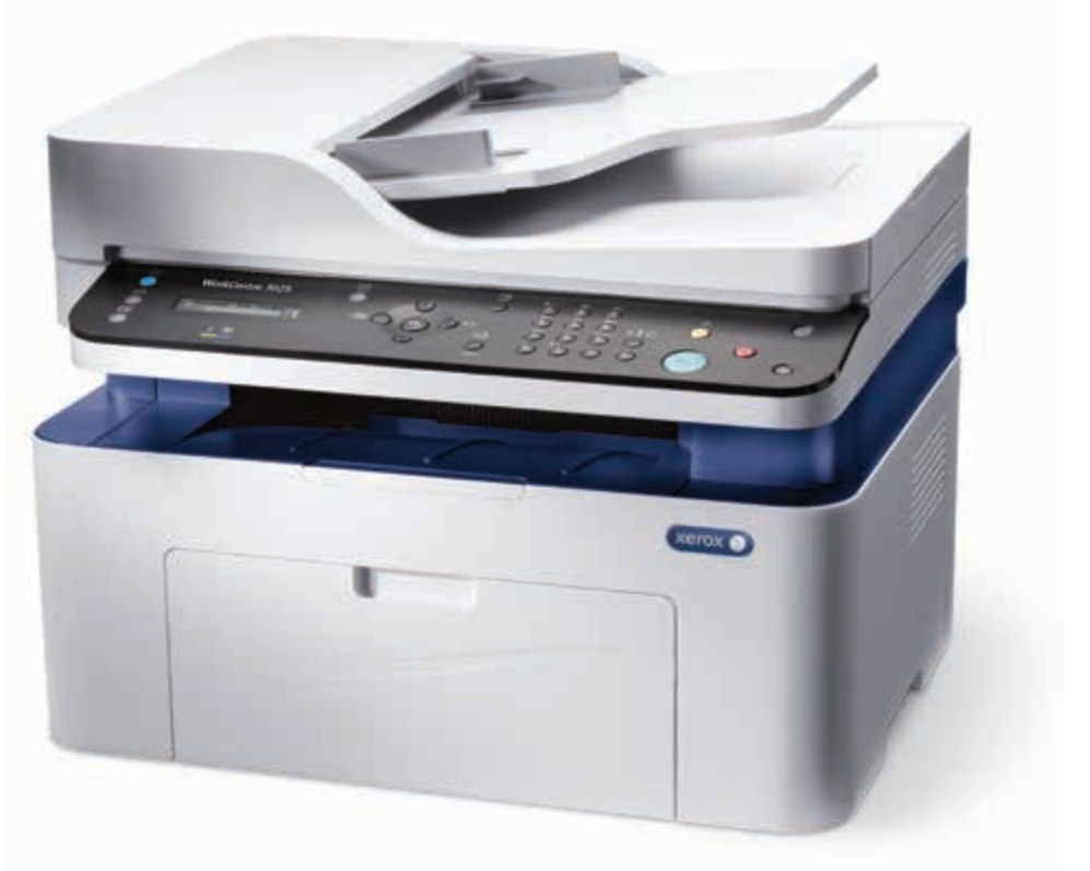
WorkCentre 3025. Kopyalama. Yazdırma. Tarama. Faks.*

* Faks ve ADF yalnızca WorkCentre 3025NI'da kullanılabilir.